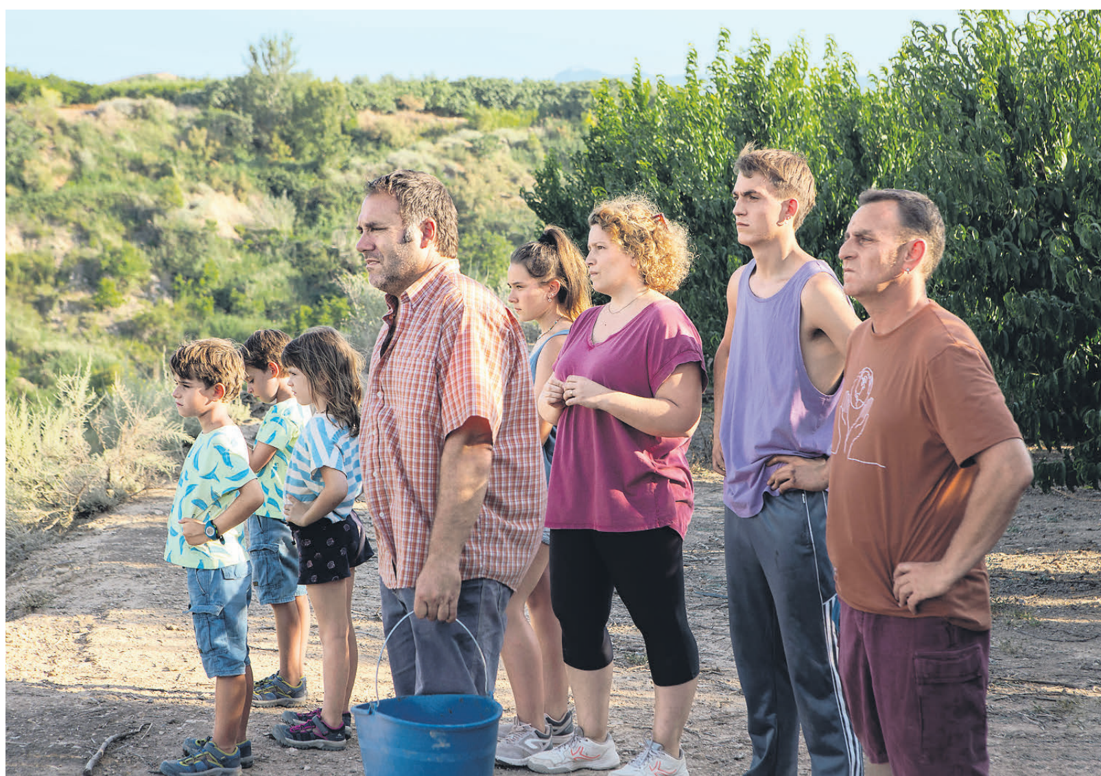
Многочисленное семейство Соле крепко пустило корни и в родной земле, и в извечном аграрном укладе жизни.

Хотя в основе конфликта лежит экономический интерес, фильм далек от грубого материализма; он поэтизирует духовное чувство