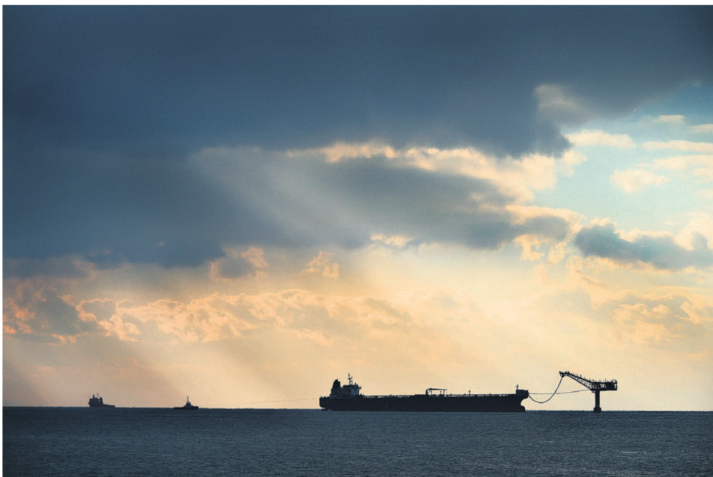
США наконец заметили высокую стоимость российской нефти, но вопрос в том, могут ли они надавить на ее покупателей

Кроме того, OFAC предупредила нефтрейдеров и товарных брокеров, чтобы транспор-