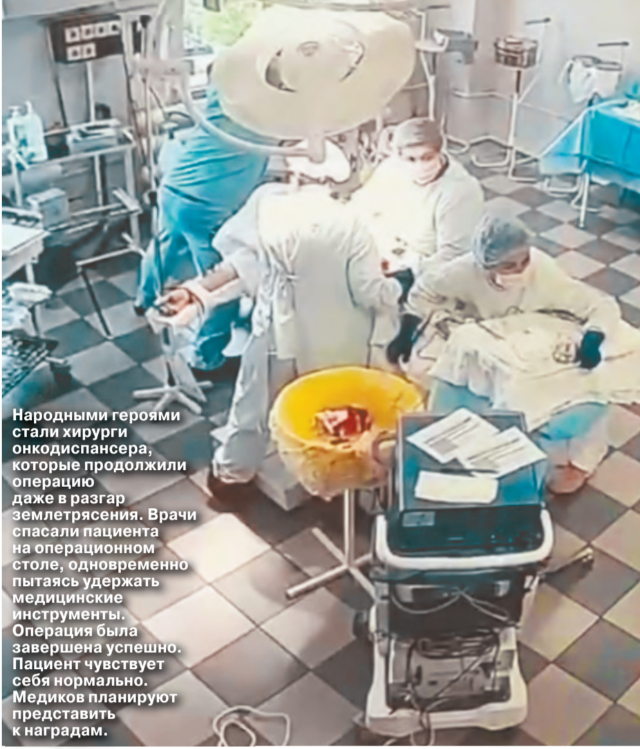
Народными героями стали хирурги онкодиспансера, которые продолжили операцию даже в разгар землетрясения. Врачи спасли пациента на операционном столе, одновременно пытаясь удержать медицинские инструменты. Операция была завершена успешно. Пациент чувствует себя нормально. Медики планируют представить к наградам.