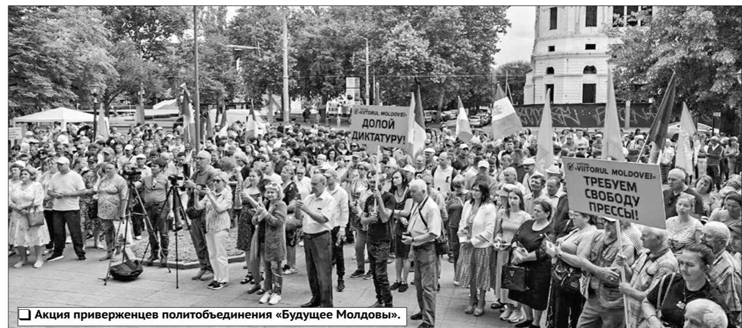
Акция приверженцев политобъединения «Будущее Молдовы».

Как показывают свежие социологические исследования, республика входит в стадию экзистенциального распада, одновременно сталкиваясь с демографическим кризисом и психологической капитуляцией — отходом общества от планирования будущего, что рискует привести к вымиранию Молдавии. «Мы не увидим другим этническим группам путь закрыт — элита отгородилась, страна тонет. Если вектор сохранится, то Молдавия, которую вследствие безработицы ежегодно покидают тысячи молодых людей, испарится, — указал Шырля. Повсеместно закрываются школы и вузы, гибнут города. Численность новорождённых упала с 39 до 24 тысяч, причём есть сёла, где за последние 15 лет на свет не появились ни один ребёнок. Сельское хозяйство мертвое, промышленность уничтожена, наука — формальность. Молодёжь не в состоянии учиться, взять кредит, а тем более купить жильё в условиях, когда квадратный метр стоит 1900 евро. Банки зарабатывают миллиарды, а граждане нищают. Это не модернизация. Это демонтаж страны.