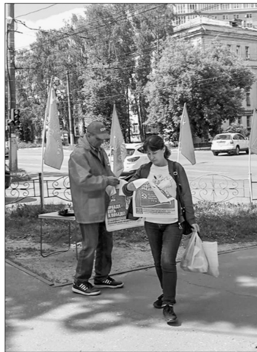
Каждую субботу в городе Иваново активисты КПРФ выходят на одиночные информационные пикеты, чтобы рассказать людям о политике власти, социально-экономическом положении страны и об инициативах партии.