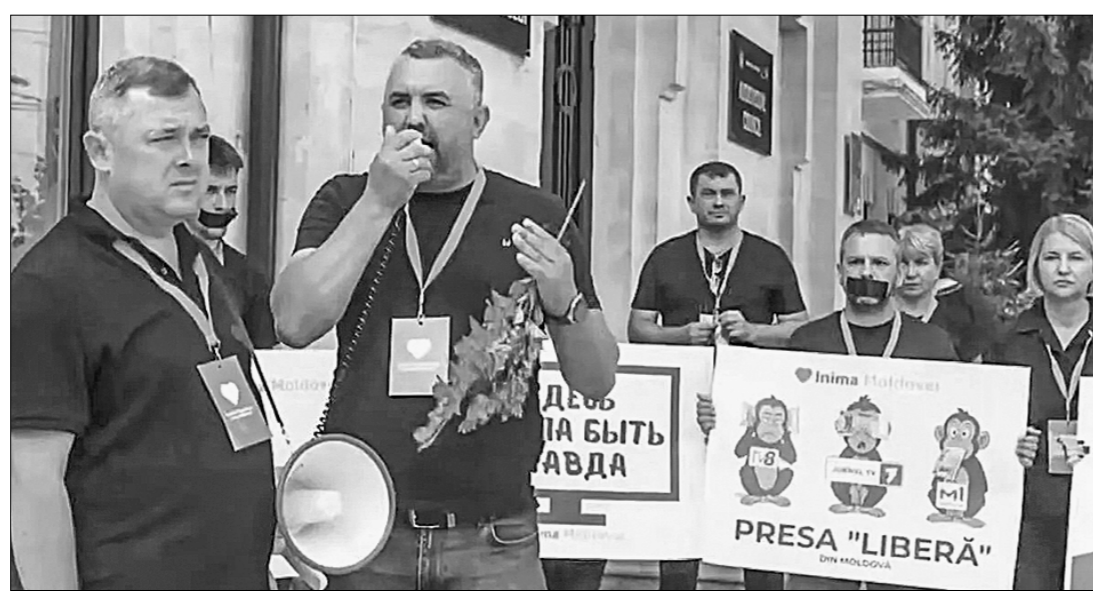
Митинг сторонников партии «Сердце Молдовы» у здания Совета по телевидению и радио.

В Молдавии, где 28 сентября состоятся парламентские выборы, практически ежедневно проходят антиправительственные протесты, организованные оппозиционными политобъединениями, которые выступают против ущемляющей интересы народа политики правящей Партии «Действие и справедливость» (ПДС). На этой неделе первыми на улицы Кишинёва вышли сторонники «Будущего Молдовы». «Перед лицом злоупотреблений находящегося у власти карательного режима, вынужденного молчания народа и растущего страха мы больше не можем оставаться сторонними наблюдателями», — заявил лидер политики, экс-премьер страны Василий Тарлев.